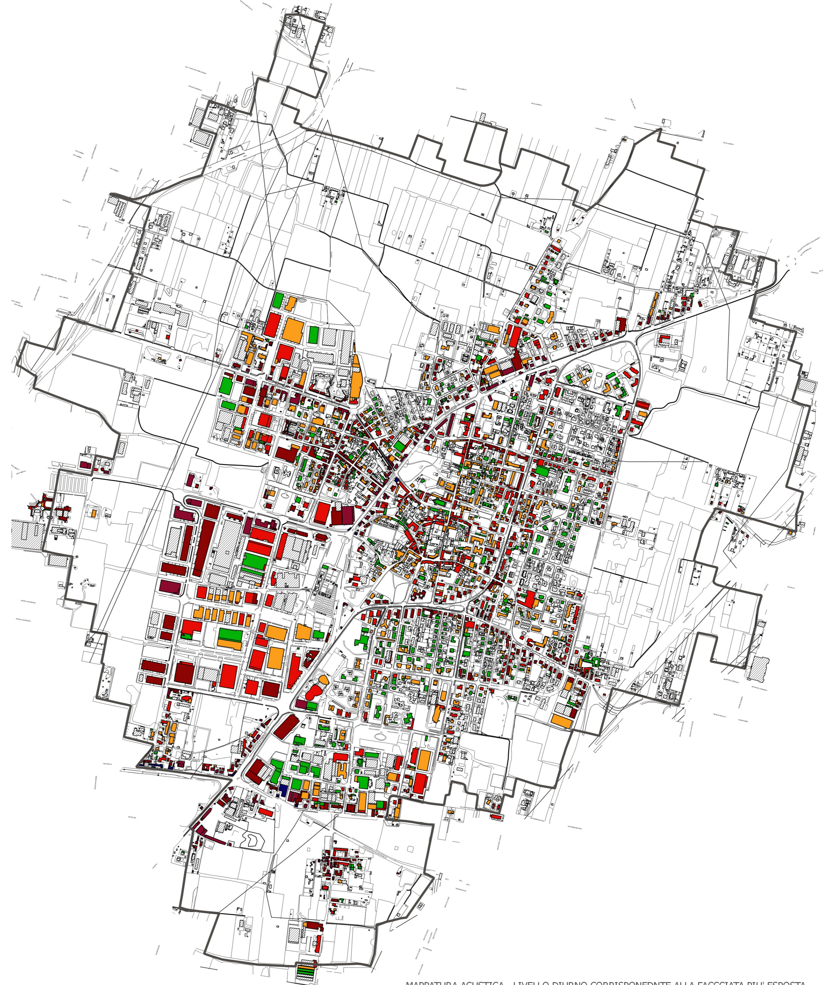
MAPPATURA ACUSTICA - LIVELLO DIURNO CORRISPONDENTE ALLA FACCIATA PIU' ESPOSTA