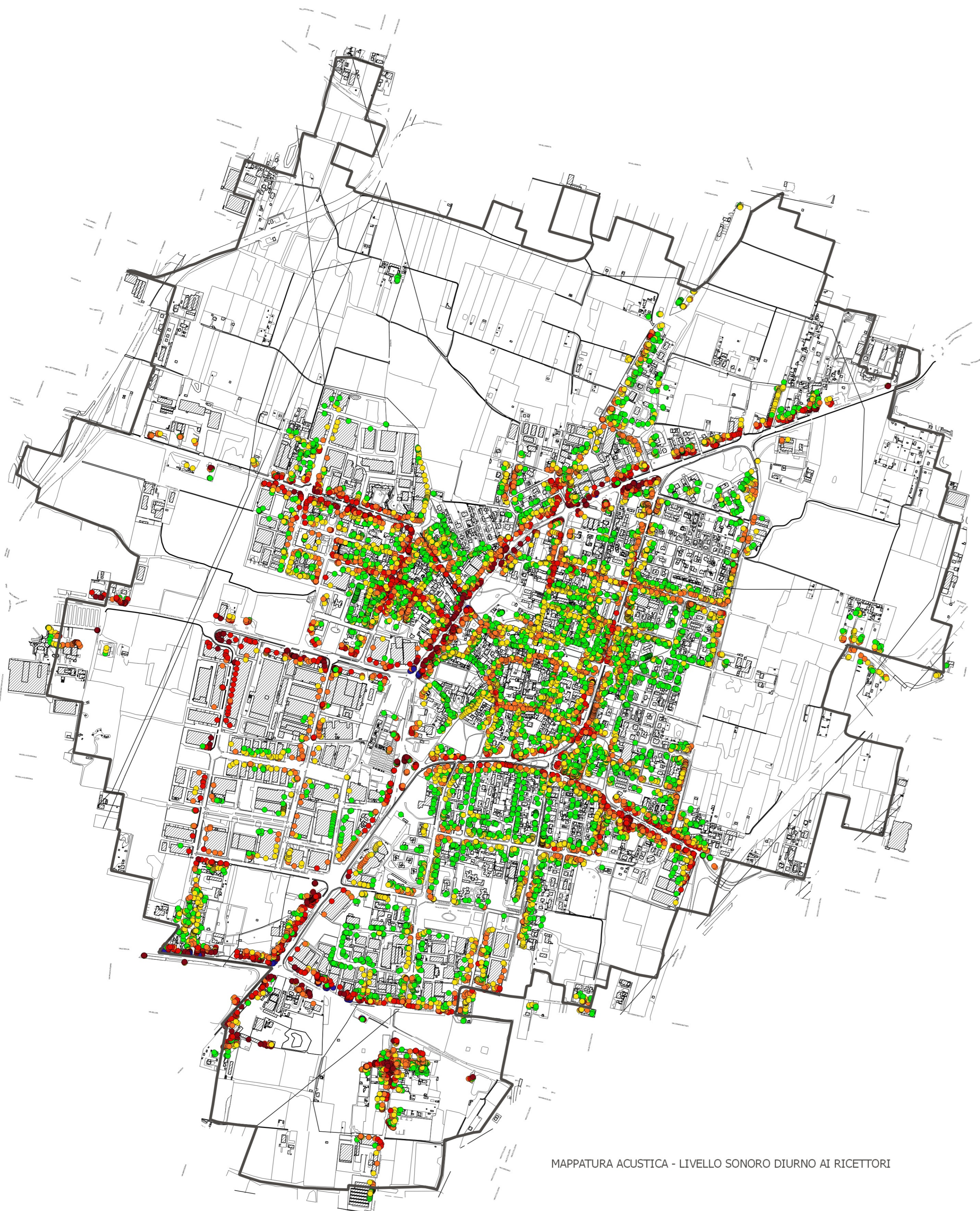
MAPPATURA ACUSTICA - LIVELLO SONORO DIURNO AI RICETTORI